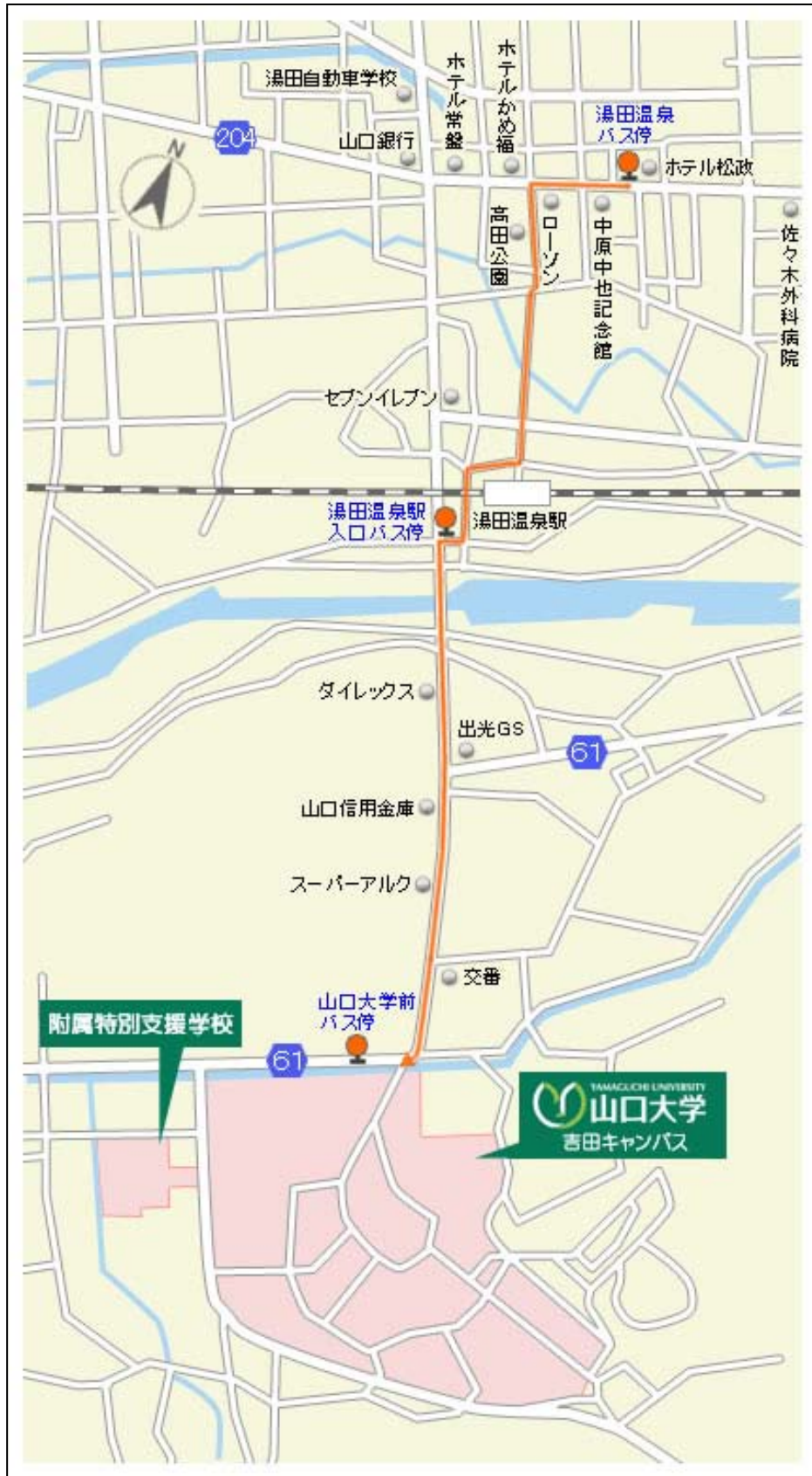
湯田温泉駅からの徒歩ルート（山口大学ホームページより抜粋）

http://www.yamaguchi-u.ac.jp/info/13/616.html