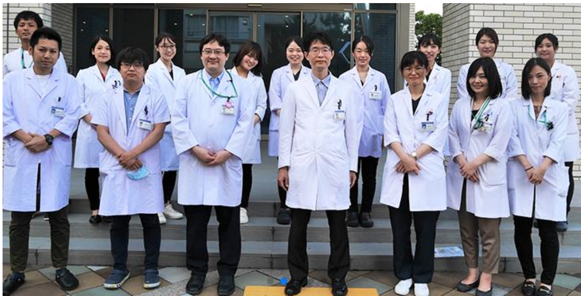
医局員 21 名（男性医師：6 名 女性医師：15 名 （2021 年度）