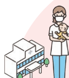
病児保育施設等利用助成