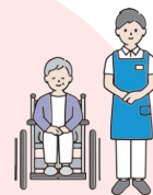
介護と仕事の両立支援