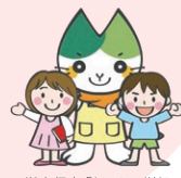
学童保育「ヤマミ学級」・一時保育の実施