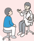
臨床心理士によるカウンセリング