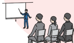
シンポジウム・セミナーの実施