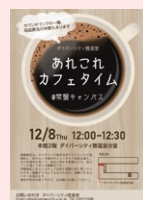
あれこれカフェタイムの開催

学生・教職員の性別、年齢、障害、民族、性的指向や性自認などの多様性が尊重され、各自の個性と能力が最大限に発揮できるようなダイバーシティキャンパスづくりに取り組みます。