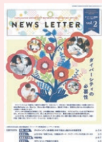
ニュースレターの発行