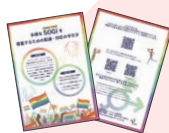
SOGIガイドライン・SOGI対応事例集の発行