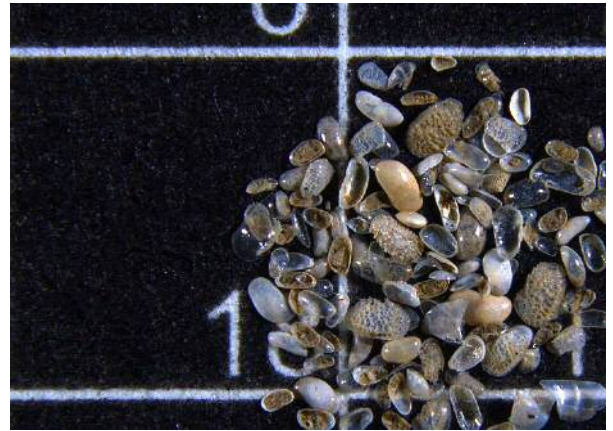
図 1 カイミジンコの殻の写真 (白い線の間は長さ約 4.5 mm)

そこで、私たちの研究室では、秋吉台の石灰岩を酢酸などの薬品で処理することにより、化石を立体標本として取り出し、立体観察に基づく古生物学的な研究を行うことを目的として、秋吉台科学博物館と協力して研究を進めています（図 2）。とくに、上で述べたように重要な環境指標・生物指標であるカイミジンコの化石を石灰岩中から取り出すことで、その実態を明らかにすることを目指しています。まだカイミジンコだと断定できる化石を取り出すことはできていませんが、カイミジンコをはじめとした小さな化石から得られる情報から秋吉台石灰岩の形成された当時の環境や生物相をより詳しく解明したいと考えています。