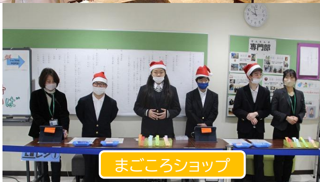
まごころショップ