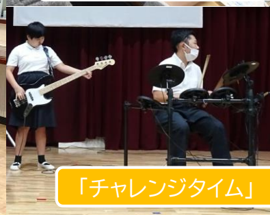
「チャレンジタイム」