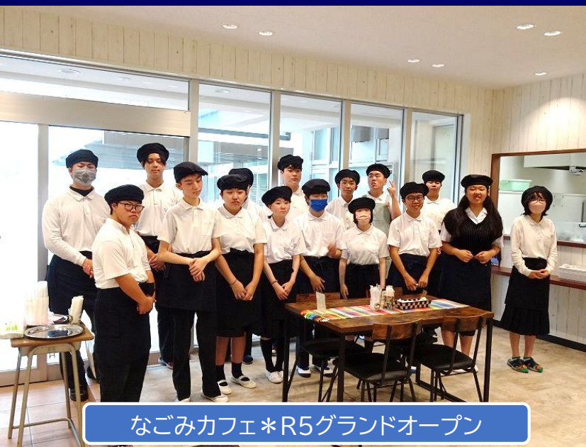
なごみカフェ*R5ランドオープン

*詳しくは、別添募集要項を御覧ください。（本校ホームページからでも、みることができます。）