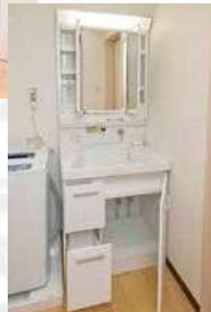
収納力抜群の三面鏡。深めのシンクは、シャンプーにも十分に対応