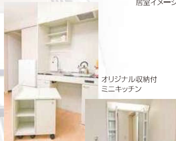
オリジナル収納付ミニキッチン