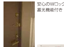
安心のWロック 蓄光機能付き