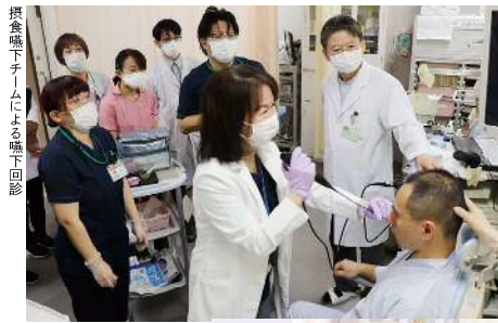
摂食嚥下チームによる嚥下回診

本院には、入院患者さんを対象とした摂食嚥下専門のチームがあります。2009年4月に発足し、耳鼻咽喉科医、歯科口腔外科医、摂食嚥下認定看護師、歯科衛生士、言語聴覚士、管理栄養士の多職種で構成されています。各診療科の主治医より依頼を受けて、回診をはじめ、さまざまな嚥下治療を行っています。