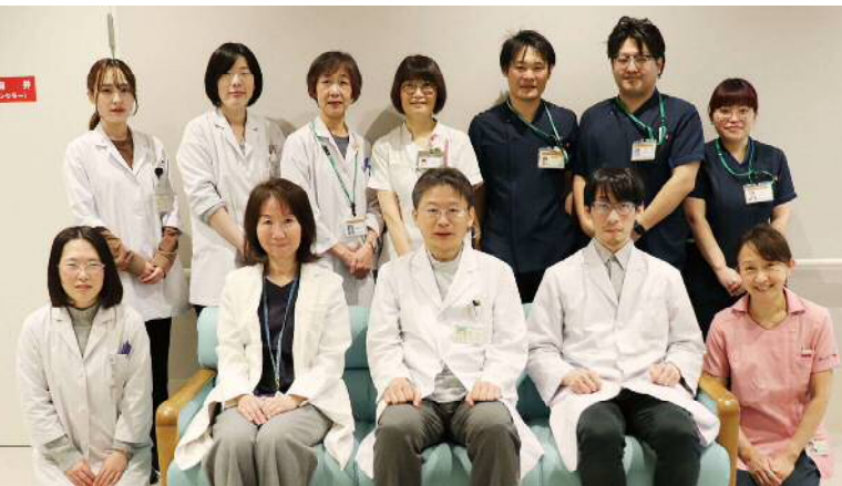
耳鼻咽喉科医師、歯科医師、摂食嚥下認定看護師、歯科衛生士、言語聴覚士、管理栄養士からなるチームです

食べ物を飲み込む時にのどに引っかかったり、食べる時に咳が出たり、飲み物を飲み込む時にむせたりしたことはないでしょうか。そういった経験がしばしばある場合、摂食嚥下障害の可能性があるかもしれません。