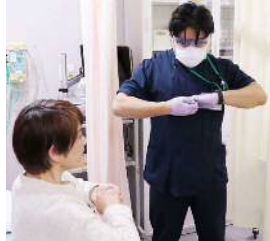
嚥下リハビリの様子

嚥下カンファレンスや嚥下回診の結果により適切な食事形態を提案しています。患者さんの嚥下機能の状態によって、同じメニューでも食事の形態を変えたり、使う食材を変えたりしています。