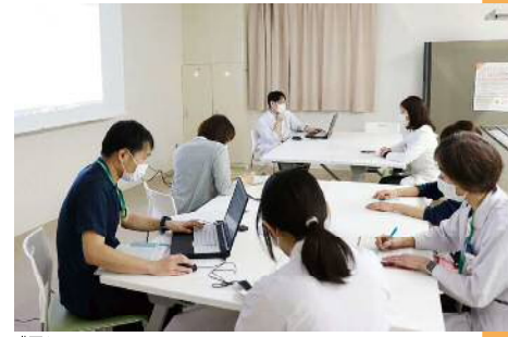
嚥下カンファレンス