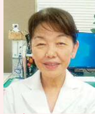
山口大学大学院医学系研究科 保健学専攻地域老年看護学講座教授

このたび、令和7年3月31日をもって定年退職いたします。皆様には大変お世話になりました。心より御礼申し上げます。 平成20年10月に大学院医学系研究科病理形態学講座教授として赴任し、病理学の研究、教育および臨床業務に従事してまいりましたが、この間の6年間（平成22年4月～平成28年3月）は附属病院病理部（現病理診断科）部長を併任し、病理部の管理運営にも携わらせていただきました。研究については、課題とじっくりと向かい合うことが許される素晴らしい環境のなか、数学の難問に取り組む高揚感に似た感覚を堪能いたしました。臨床業務における病理医不足の問題は常に抱えておりましたが、講座、附属病院病理診断科ともに協調性ある素晴らしいメンバーに恵まれ、充実した日々を過ごすことができました。この場をお借りして感謝申し上げます。 最後になりますが、山口大学医学部、大学院医学系研究科および医学部附属病院の益々の発展を祈念いたしております。