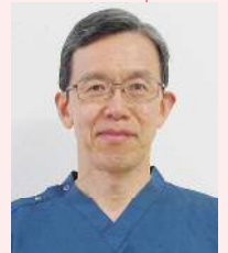
山口大学大学院医学系研究科 医学専攻麻酔・蘇生学講座教授