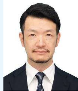
山口大学大学院 医学系研究科 医学専攻 神経解剖学講座 教授