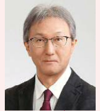
山口大学大学院医学系研究科 医学専攻病理形態学講座教授