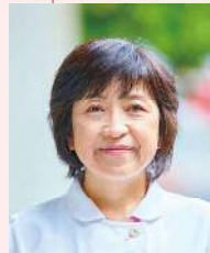
山口大学医学部附属病院 看護部長

令和7年3月末で定年退職となります。これまでの皆様からのご厚情に心より感謝申し上げます。 麻酔科蘇生科担当手術件数は増え続けており、特に併存疾患を持つ患者や高齢者などの慎重な周術期管理が求められる患者が増えています。そこで、医師、歯科医師、看護師、薬剤師、臨床工学技士など多職種でチームを結成して周術期管理を行いたいとずっと思っておりましたが、やっと令和6年1月から一部の科を対象として術後疼痛管理チームという形でスタートすることができました。ご理解・ご協力いただきました皆様に心から御礼申し上げます。人手不足でどこも大変ですが、この踏ん張りどころを乗り越えれば、結果的にチーム医療が医療レベルを向上させると信じています。活動の範囲が徐々に広がることを願っています。 ところで、今は亡き大先輩の最後のアドバイスは「定年後は意外と長いぞ」でした。もう少し現場で頑張りたいたいと思います。皆様のさらなるご活躍を祈念いたします。