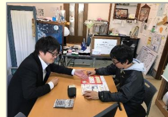
事業所での相談対応

商工業者への経営相談、経理・労務等の指導を行うと共に、中小企業の抱える諸問題を聞き取り、改善等の提案を行う総合経済団体です。商工会は「行きます、聞きます、提案します」をモットーに支援を行っています。