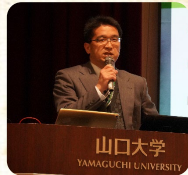
山口大学地域未来創生センター

この度、若者定着促進室が行なっている若者定着・人材育成に関わる事業活動、地元企業、やまぐちの魅力などを皆様と共有できたらという思いで「わかそく瓦版」を創刊いたしました。ご愛読くださいますよう、よろしくお願いいたします。