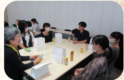
若手社員との交流の様子(株式会社アデリーにて)