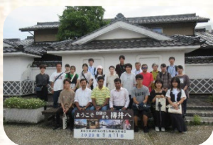
記念撮影(柳井市・白壁ふれあい広場にて)