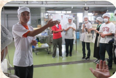
工場見学の様子(株式会社豆子郎にて)

※当初は8月10日の開催を予定していましたが、台風接近に伴う悪天候のため9月11日に延期しました。