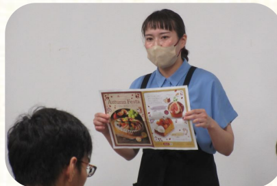
業務説明の様子(あさひ製菓株式会社にて)