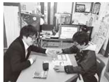
事業所での相談対応の様子

商工会は「商工会法(昭和35年制定)」という法律に基づいて設立された特別認可法人です。「経営に関するまちのお医者さん」として、地域の事業者が抱える様々な悩みに対して解決策の提案などを行っています。また、経済活動を通じて地域に「にぎわい」を作り出し、元気な地域づくりと商工業発展のための活動も行っています。日本の全企業の約86%は小規模事業者が占めています。そのような日本経済を支えている小規模事業者を支援する商工会の仕事はとても有意義でやりがいのある仕事です。