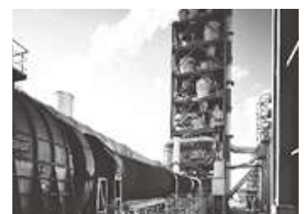
ロータリーキルン

当社は宇部興産の機械部門として発展してきた会社です。「いいものを世界に」を企業理念に大型製品の産業機械を製造しています。事業は設計・製造・アフターサービスまで一貫して行っております。製品はお客様の要望に応じて仕様を変えてオンリーワンの製品づくりを行っています。当社の技術で生み出される製品は世界中の産業を支えています。2020年8月にU-MHIプラテックと合併し、両社の技術を融合し、更なる事業展開を目指しています。