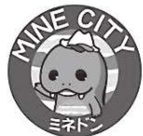
美祢市公式キャラクター

美祢市に住み、一緒に知恵を絞って市の未来を考え、市の将来を築く意欲ある若者を待っています。