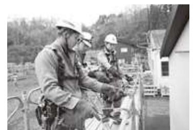
【指先込める安全の願い】

これからも、義勇の精神を持った、とび技能士を育成する事で、多くの若者が夢を実現していける力を身に付けられるよう応援したいと考えています。