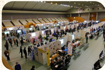
会場の様子(維新百年記念公園 維新大晃アリーナ)