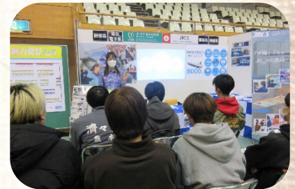
ブース説明の様子