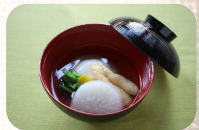
かぶ雑煮 作成：池田博子氏

※参考資料：畑江他 正月の雑煮の食べ方に関する実態調査、日本調理科学会誌Vol. 36 No. 3 234-242 (2003)