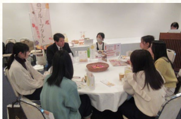
フリートークの様子