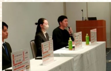
パネルトークの様子