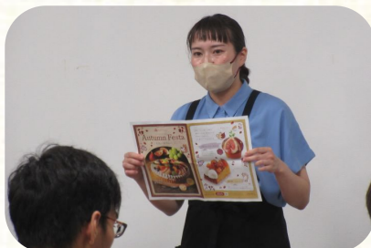
業務説明の様子(あさひ製菓株式会社にて)