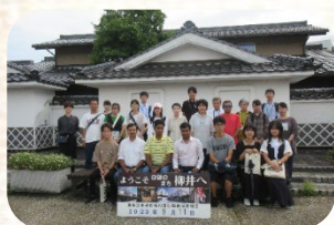
記念撮影(柳井市・白壁ふれあい広場にて)