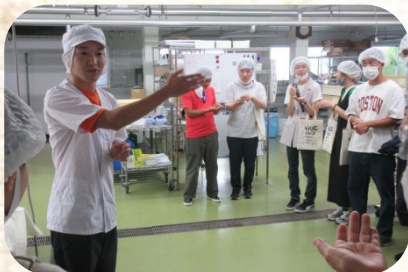
工場見学の様子(株式会社豆子郎にて)

※当初は8月10日の開催を予定していましたが、台風接近に伴う悪天候のため9月11日に延期しました。