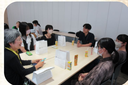
若手社員との交流の様子(株式会社アデリーにて)