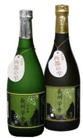
山口大学オリジナル日本酒「長州学舎」 (左) 純米酒 (右) 純米大吟醸 https://www.yamaguchi-u.ac.jp/info/logo_goods/index.html