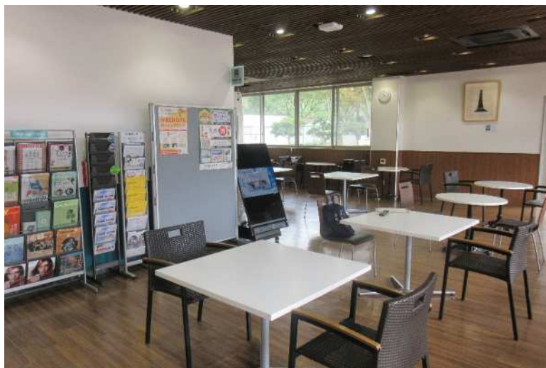
吉田キャンパス 総合図書館(りぶカフェ)