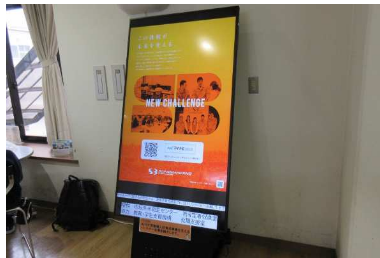
常盤キャンパス 工学部食堂