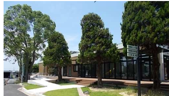
工学部図書館（常盤キャンパス）