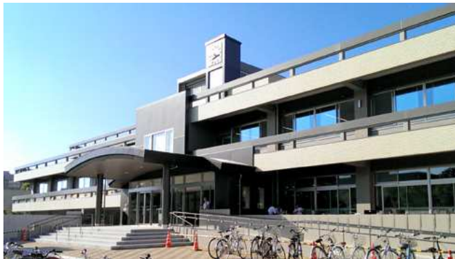
総合図書館（吉田キャンパス）

総合図書館（吉田キャンパス）及び工学部図書館（常盤キャンパス）において、約1ヶ月にわたり特別展示としてキャリアパートナー企業のポスター展示を行います。企業紹介（理念、特色、業務内容、先輩の活躍）やインターンシップの募集が可能です。