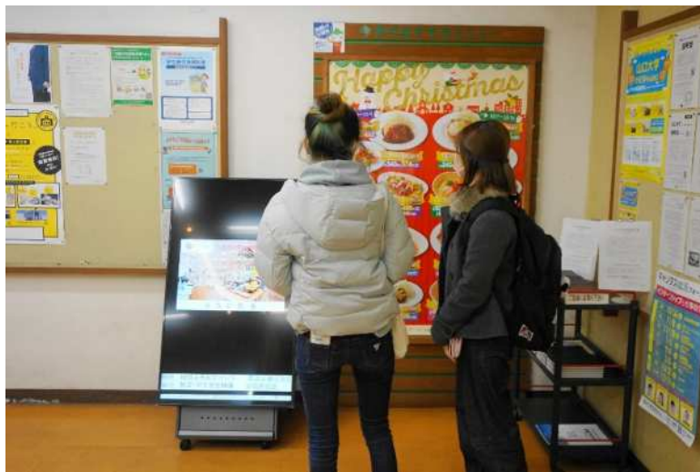
吉田キャンパス 第一学生食堂ボーノ